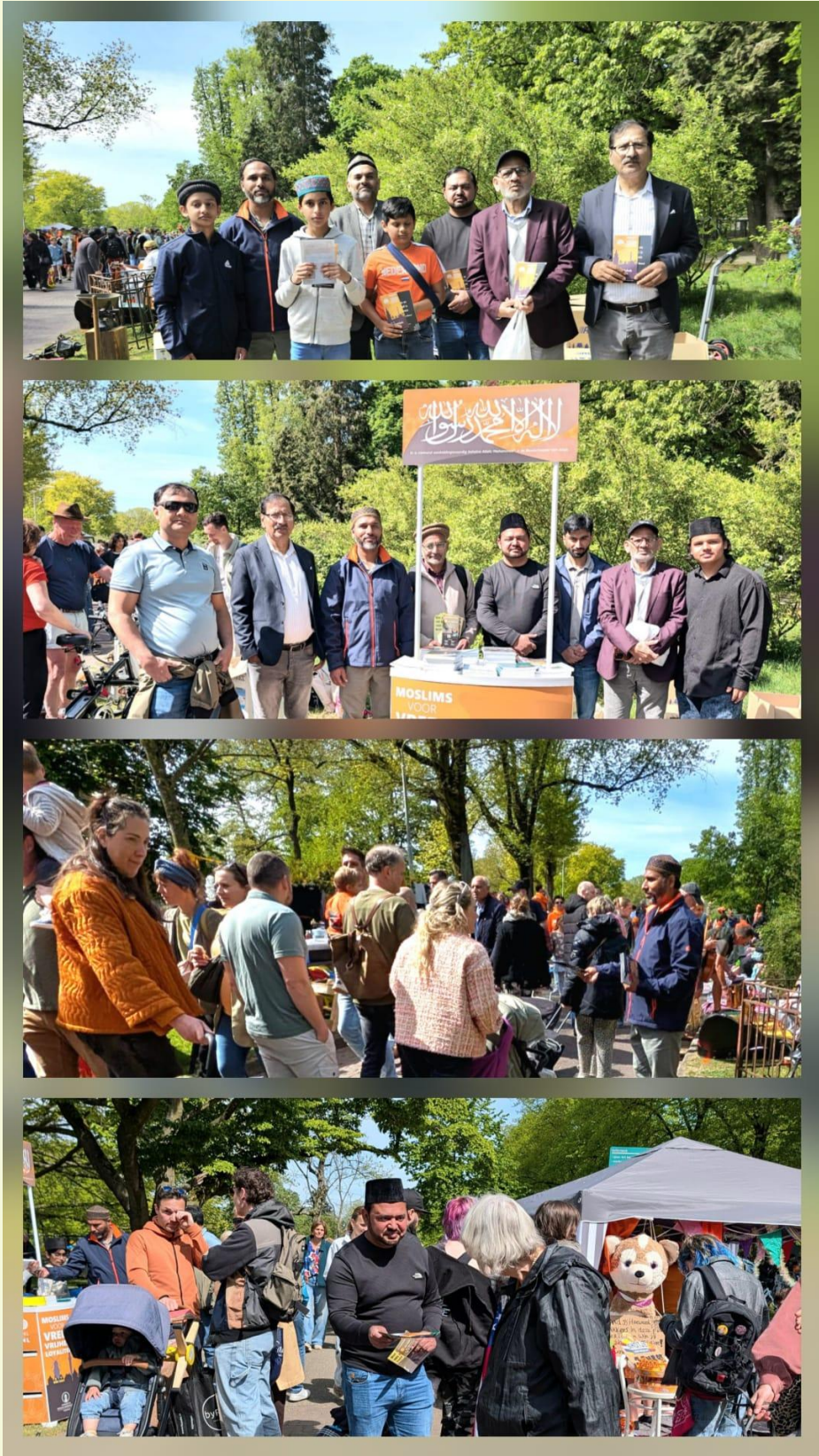
الحمد للہ، 27 اپریل کو انگلڈے کے موقع پر مجلس نائیمینین کو تبلیغی اسٹال لگانے کا موقع ملا، جس میں 8 انصار نے شرکت کی۔